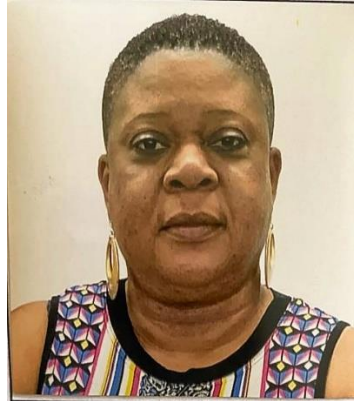
GRACIEUSE JEUNE VICE-PRESIDENT